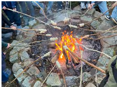
Stockbrot am Lagerfeuer